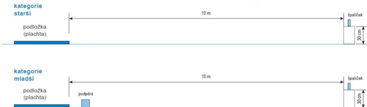
schéma stanoviště Střelba ze vzduchovky

V kategorii mladší je povoleno použití podpěry pod vzduchovku.